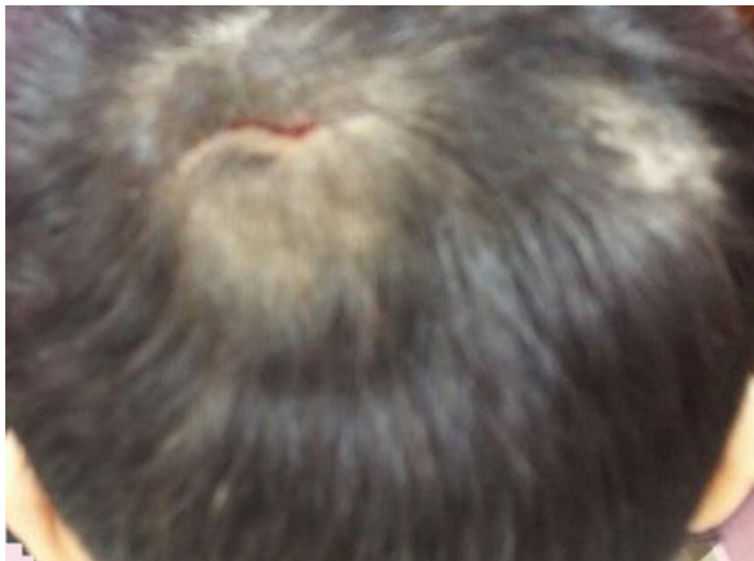
Figure 1: lésion cutanée au niveau du scalp ulcérée d'environ 3 cm