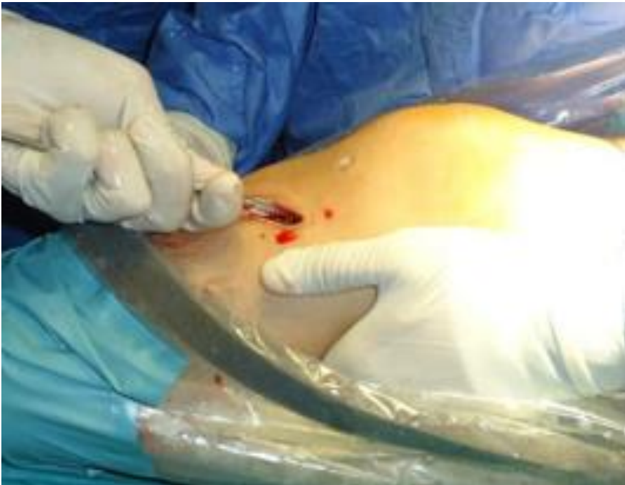
Figure 5: fixation tibiale du transplant par des vis d'interférence résorbables