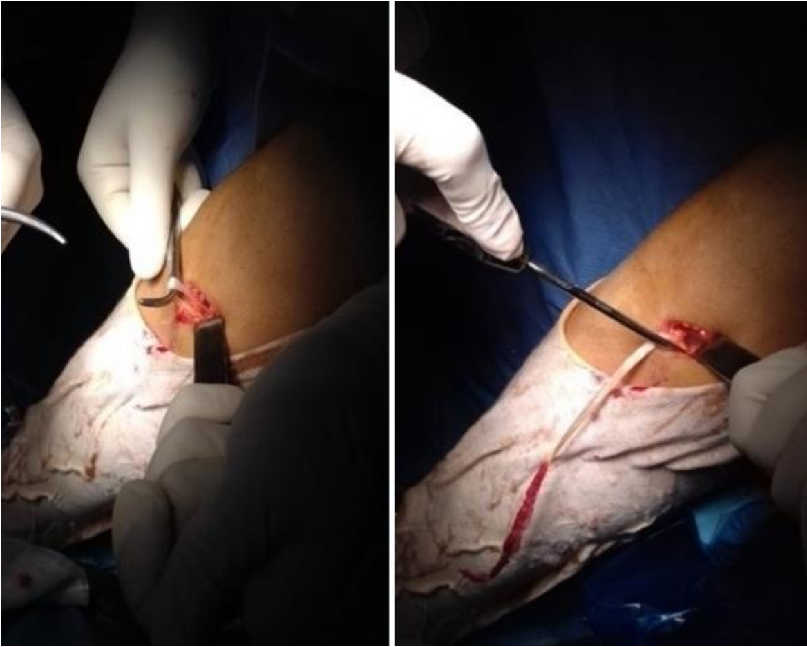
Figure 2: prélèvement du tendon droit interne et du semi-tendineux