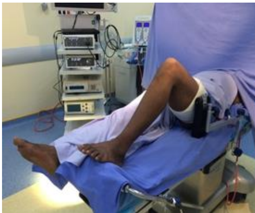
Figure 1: installation sur table: genou fléchi à 90° avec un appui placé au bout de la table