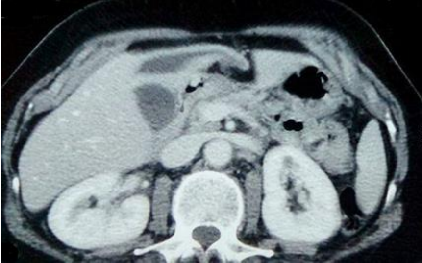
Figure 1: Une coupe scannographique montrant un kyste hydatique du segment IV du foie affaissé