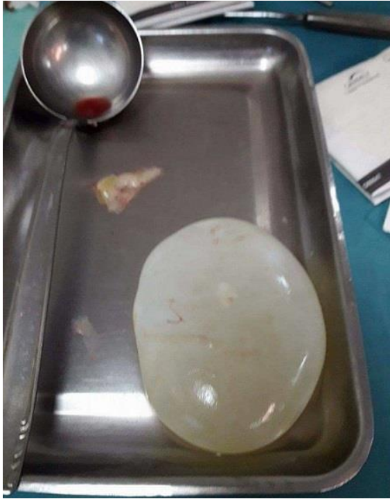
Figure 3: Membrane proligère intacte