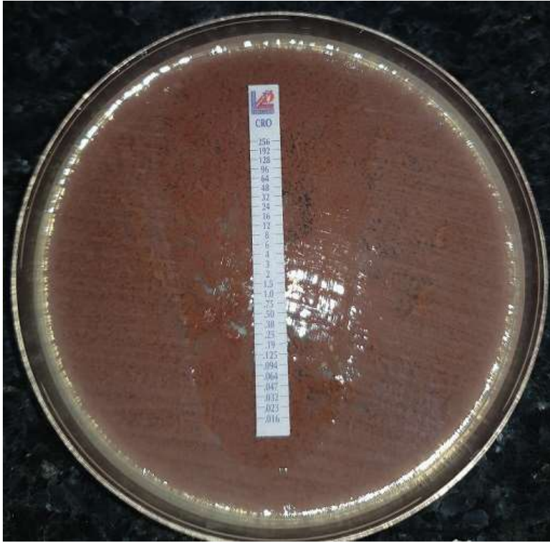
Figure 2: Concentration minimale inhibitrice Ceftriaxone