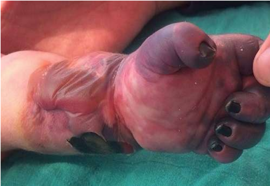
Figure 1 : image de la face palmaire de la main montrant la nécrose et son étendu