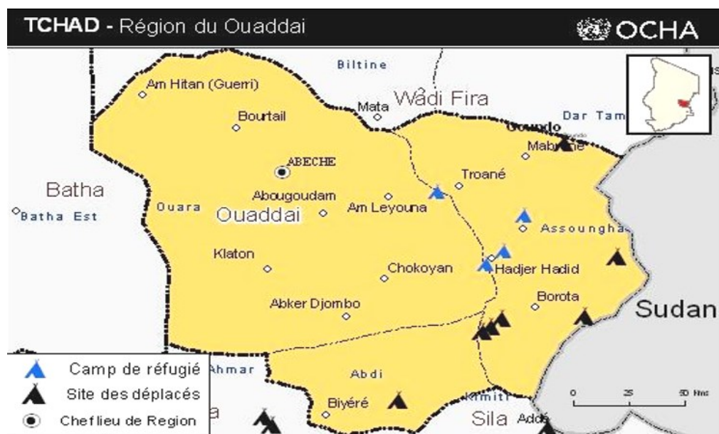
Figure 1: carte administrative de la région du Ouaddaï