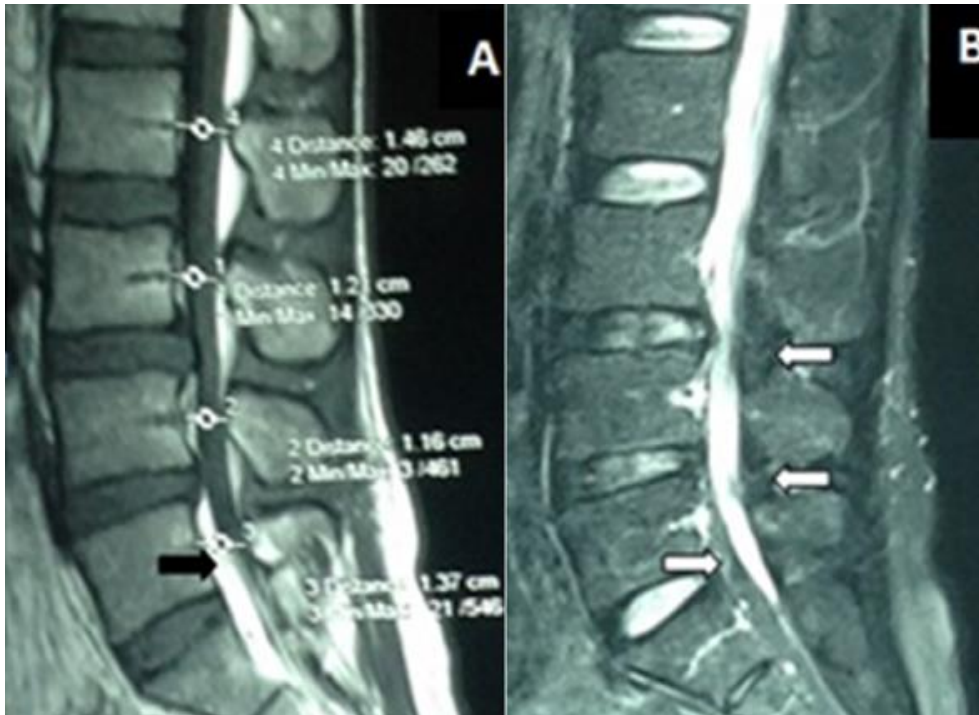
Figure 1: (A) IRM lombaire du patient en reconstruction sagittale la séquence T1 montre un débord discal en L3-L4 et L4-L5 associé à un épaississement compressif de la graisse épidurale antérieure hyperintense en L5 (flèche noire) et dans l'espace épidural postérieur de L2 à L5; (B) la séquence T2 montre la compression du fourreau dural par la graisse épidurale qui est hypointense en L2, L3, L4 et L5 (flèche blanche)