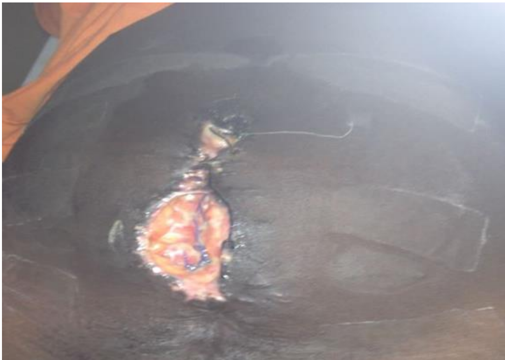
Figure 2: Photo d'un cas d'infection nosocomiale à l'Hôpital général de Référence de Katuba