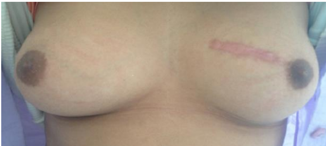
Figure 2: Aspect clinique post chirurgical (première tumorectomie)