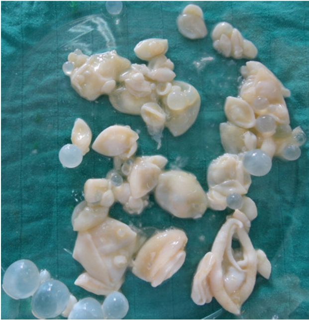
Figure 1: Membrane prolifère et vésicules filles du kyste hydatique