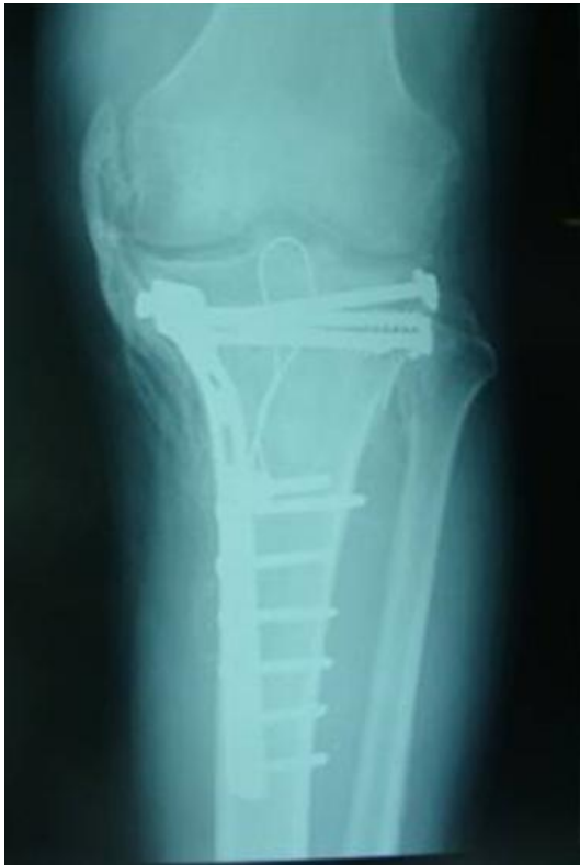
Figure 1: Pont osseux le long du compartiment interne longeant le LLI