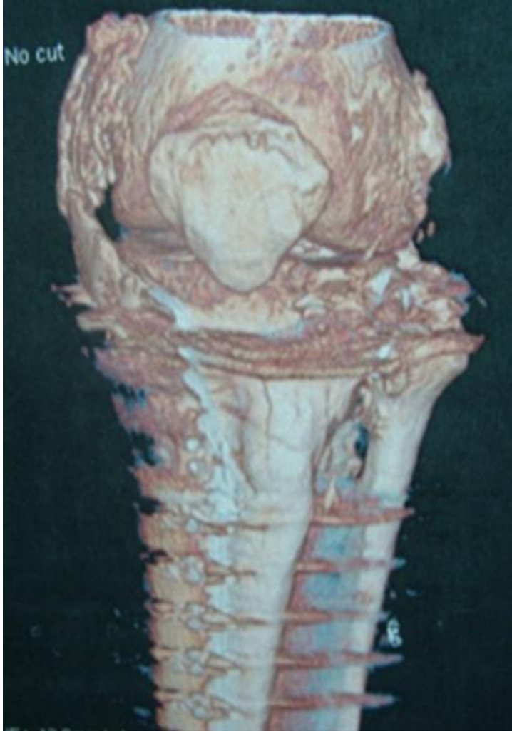
Figure 3: Tomodensitométrie en trois dimensions: ossification du LLI