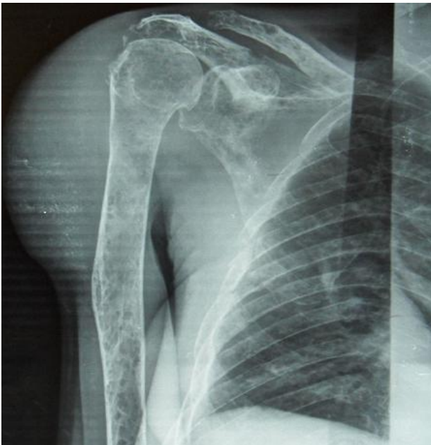
Figure 2: Radiographie de face de l'humérus droit montrant une tuméfaction en regard de l'épiphyse et diaphyse humérale correspondant à un plasmocytome cutané: déminéralisation diffuse avec un amincissement des corticales; lésions ostéolytiques multiples à type de geode