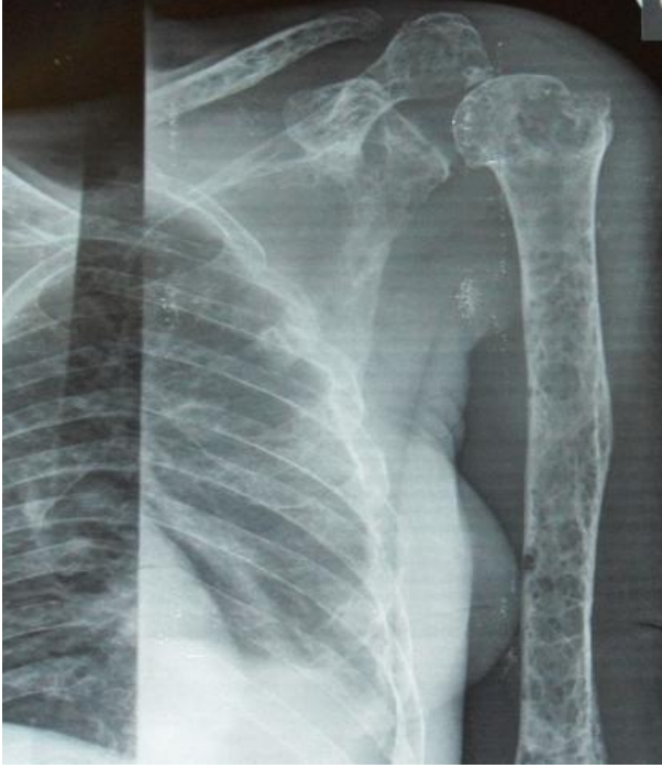
Figure 3: Radiographie de l'humérus gauche mettant en évidence une déminéralisation humérale diffuse, un amincissement des corticales et des géodes à l'emporte-pièce diaphysaire