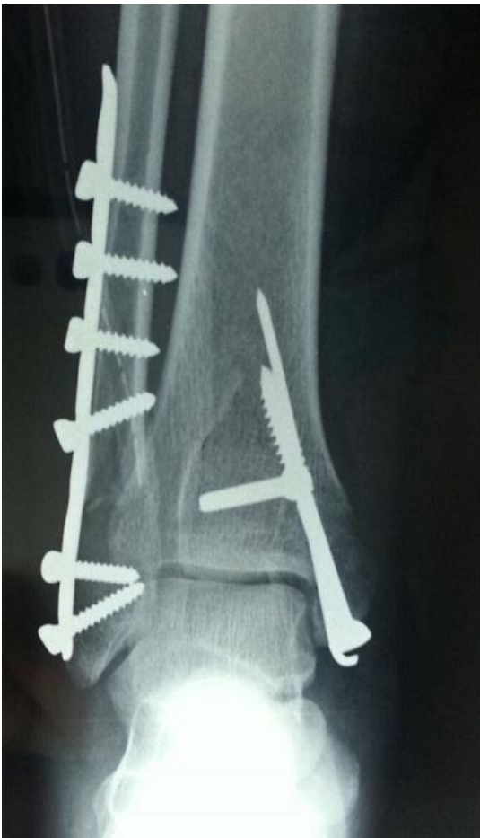
Figure 3: Radiographie de face cheville gauche montrant le contrôle post opératoire