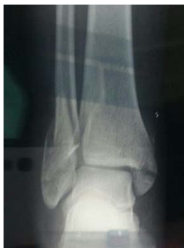
Figure 1: Radiographie de la cheville gauche montrant la fracture bimalléolaire