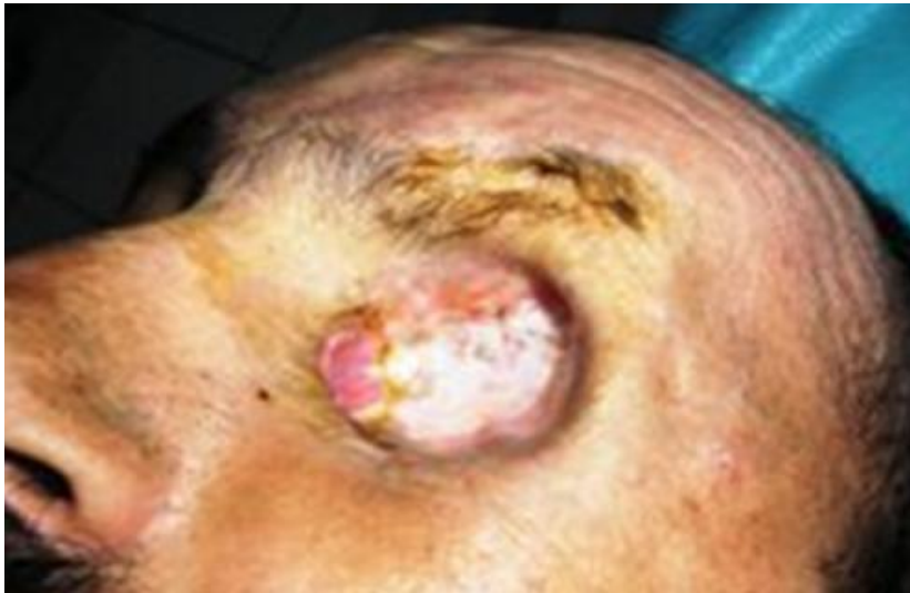
Figure 4: Exentération de l'œil gauche