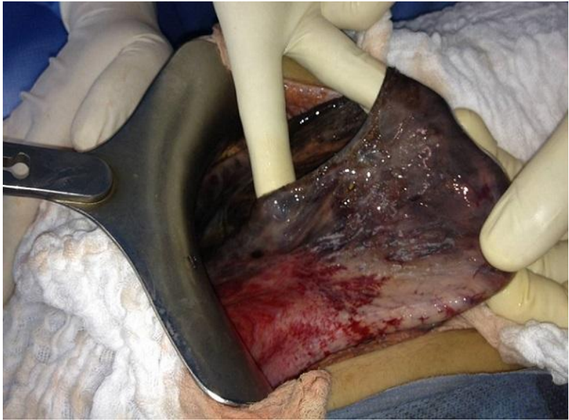
Figure 2: Image pér-opératoire montrant l'étendue de la nécrose gastrique