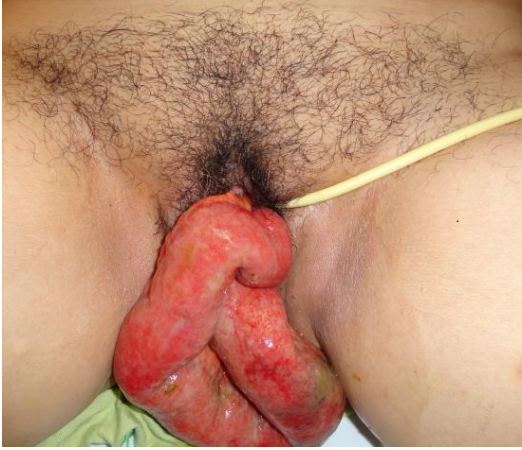
Figure 1: éviscération trans- vaginale de l'intestin grêle