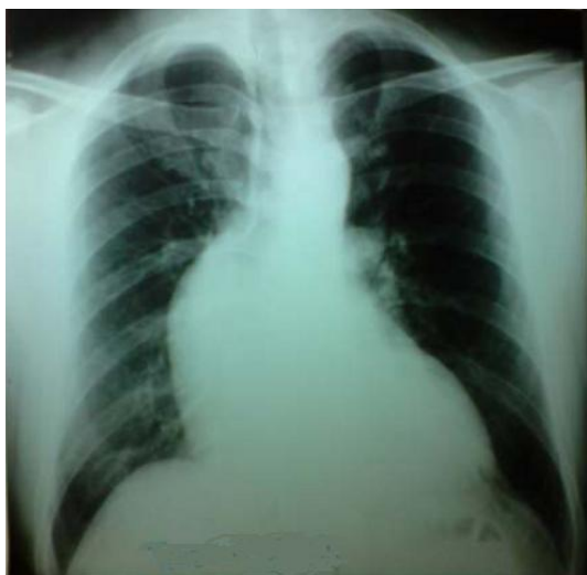
Figure 1: Radiographie du thorax: élargissement médiastinal