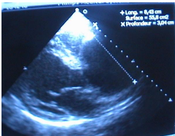
Figure 2: Coupe parasternale, grand axe, montrant la dilatation de l'aorte ascendante