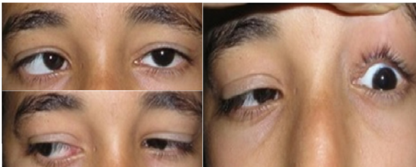
Figure 1: limitation du muscle droit externe gauche avec hyperaction du muscle droit interne de l'œil droit