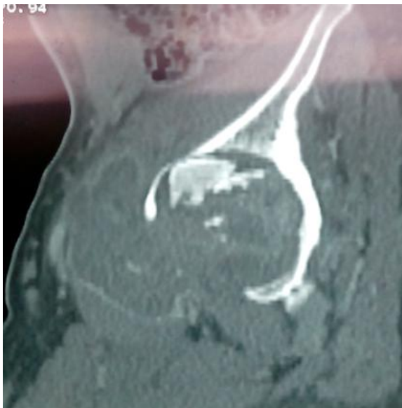
Figure 2: TDM d'une ostéoarthrite tuberculeuse de la hanche avec des abcès