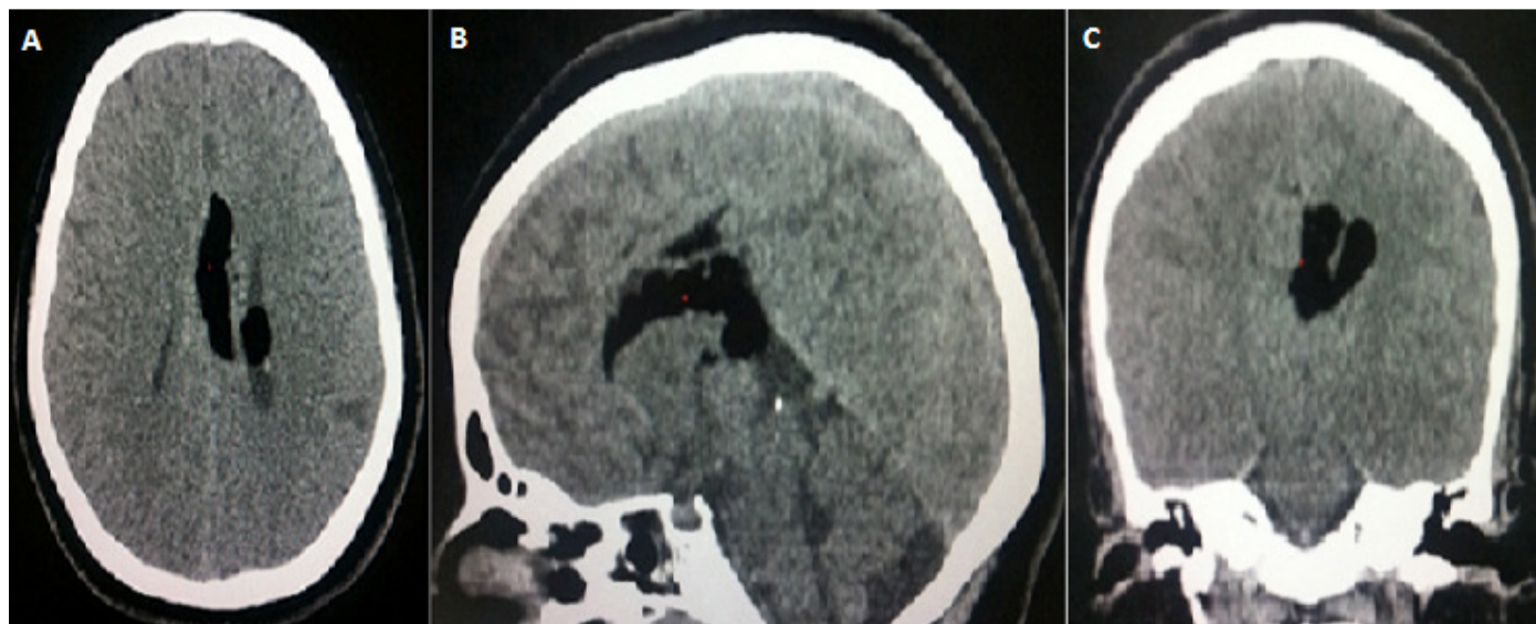
Figure 1: (A,B,C): TDM cérébrale en contraste spontané, en coupes axiale, coronale et sagittale, montrant: une formation de densité graisseuse de la ligne médiane, occupant la partie postérieure du corps calleux et s'allonge au corps, mesurant 16mm d'épaisseur, et s'étend au ventricule latéral gauche. Il s'y associe une dysgénésie du corps calleux

Figure 2: (A,B,C,D): IRM cérébrale, en Sp T1, T2 FLAIR, et saturation de graisse, en coupes axiale, coronale et sagittale, montrant: une formation de la ligne médiane, en hyper signal T1 et T2 FLAIR, s'effaçant après saturation de la graisse, siégeant au niveau du splénium, qui est dysgénésié, et s'allonge au dessus du corps calleux jusqu'au genou avec , qui est dysgénésié, avec extension dans le ventricule latéral gauche