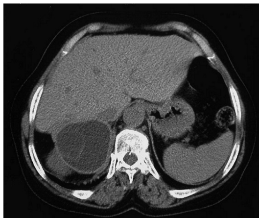
Figure 1: scanner abdominal en coupe axiale sans injection de produit de contraste: une masse kystique de densité liquidienne homogène présentant une paroi propre de la loge surrénalienne droite