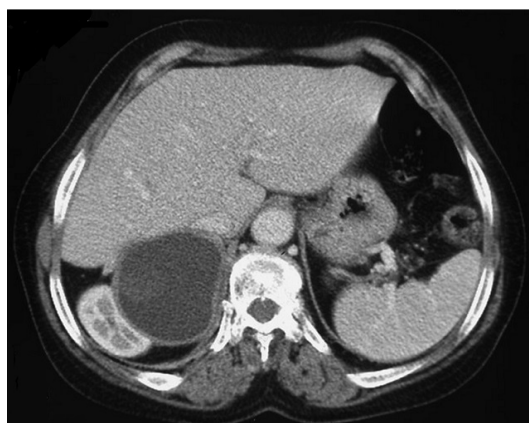
Figure 2: scanner abdominal en coupe axiale après injection de produit de contraste: Une masse kystique de densité liquidienne homogène présentant une paroi propre non rehaussée après injection de produit de contraste de la loge surrénalienne droite refoulant le pole supérieur du rein droit en arrière et en dehors