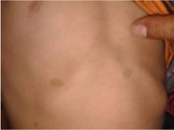
Figure 1: Taches cutanées de couleur café au lait sur le corps de l'enfant