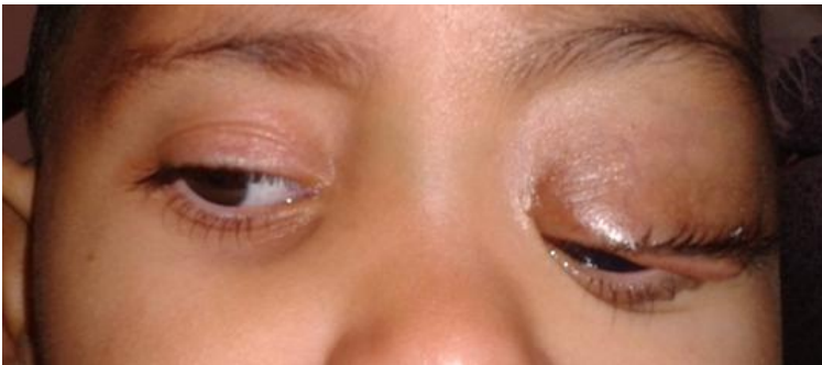
Figure 2: Névrome plexiforme de la paupière supérieure gauche