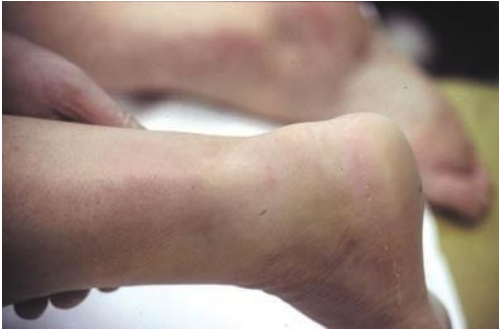
Figure 1: encoche sur le trajet du tendon d'Achille