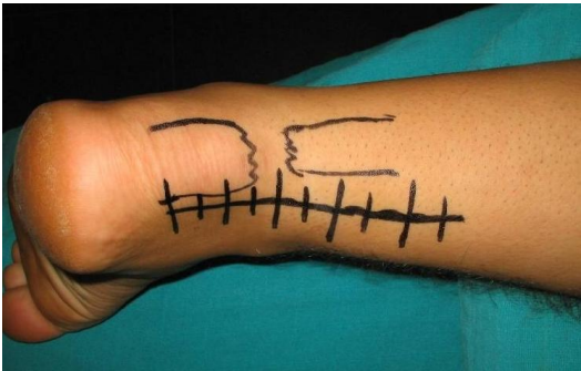
Figure 3: photo montrant l'incision cutanée latéro-Achilléenne interne et la perte de substance tendineuse