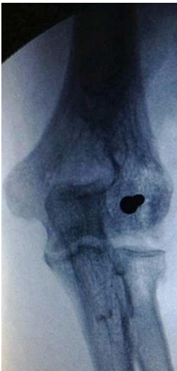
Figure 5: contrôle radiographique de face du montage