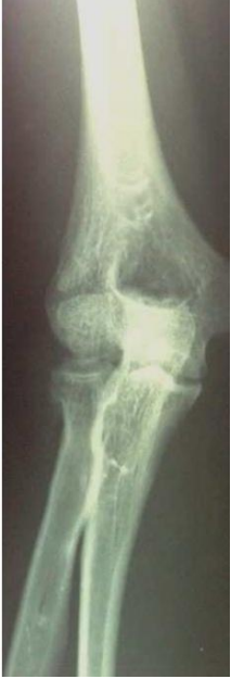
Figure 2: radiographie de face du coude droit