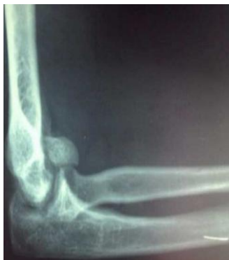
Figure 1: radiographie du coude droit de profil montrant le cal vicieux du capitellum