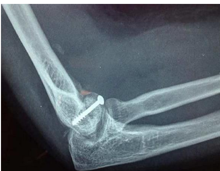
Figure 6: contrôle radiographique de profil du montage