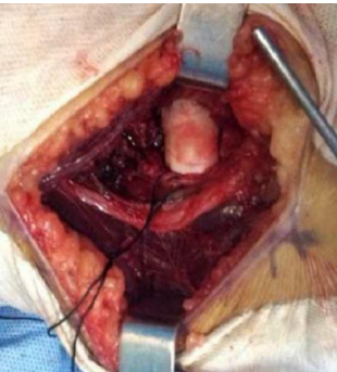
Figure 3: image per opératoire montrant le fragment osseux du capitellum en position extra anatomique