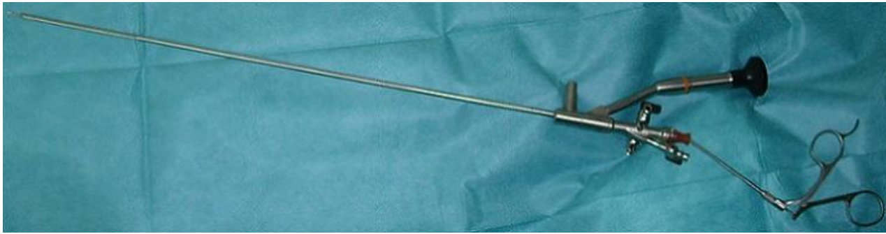
Figure 2: l'urétéroscope utilisé pour l'extraction du corps étranger