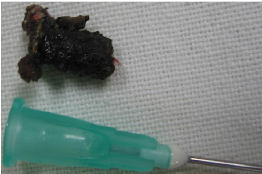
Figure 3: le corps étranger extrait