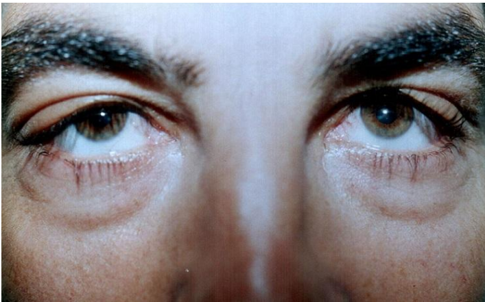
Figure 5 : le patient après traitement; nette amélioration