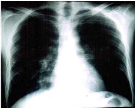
Figure 2 : radiographie thoracique montrant une image de caverne séquellaire parahilaire droite