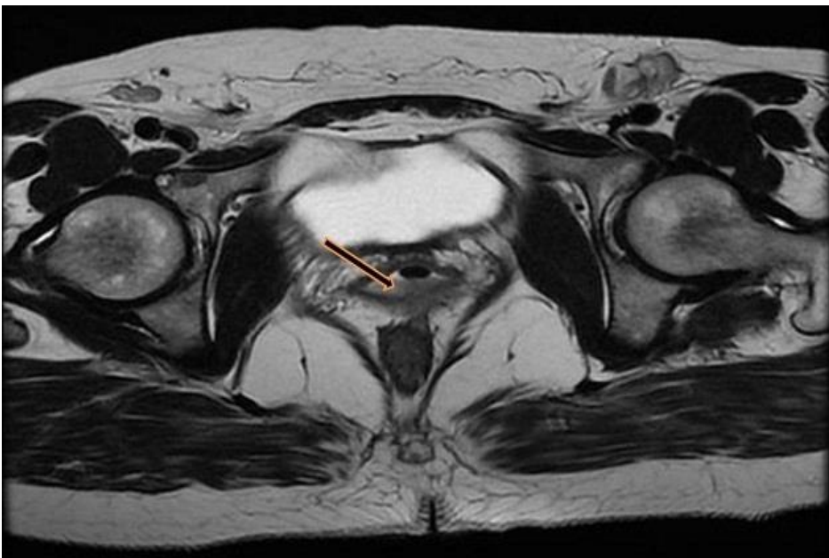
Figure 2: IRM pelvienne montrant une lésion de la paroi postéro-latérale gauche du vagin (flèche) envahissant la cloison recto-vaginale