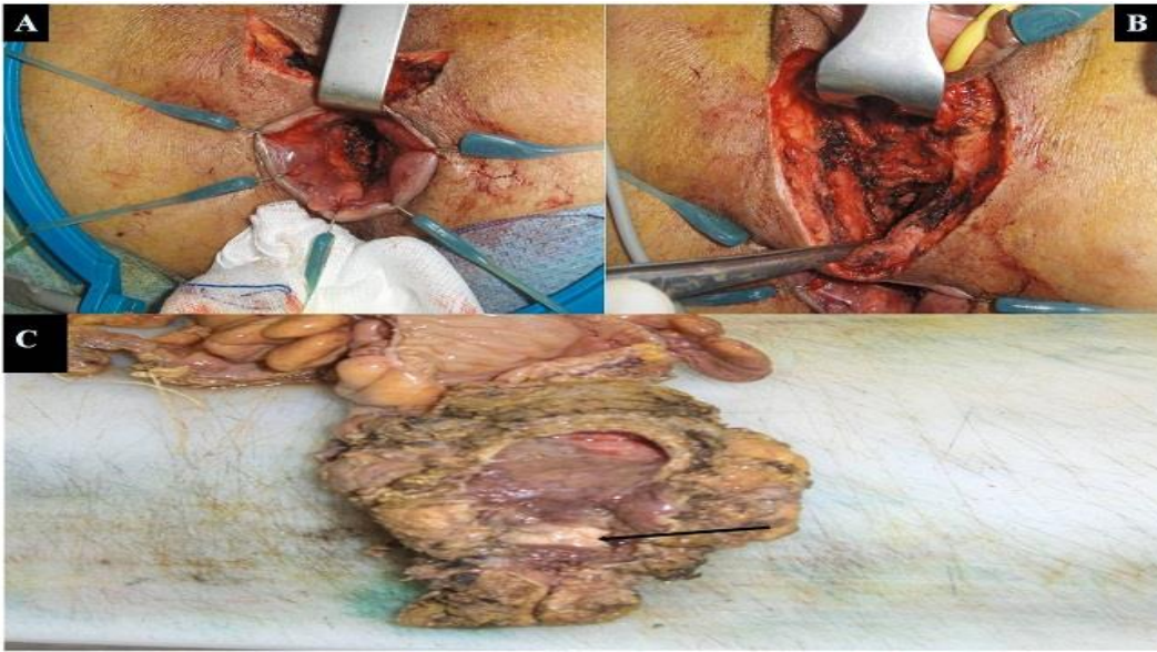
Figure 3: A) Image per opératoire montrant la résection intersphinctérienne par voie périnéale. B) Image per opératoire montrant la résection de la paroi postérieure du vagin. C) Photo de la pièce opératoire, montrant une lésion blanchâtre de la paroi postérieure du vagin (flèche), qui correspond à l'adénocarcinome vaginale après radio chimiothérapie néo adjuvante