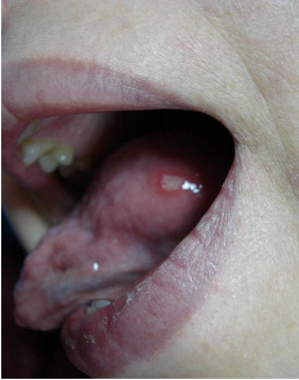
Figure 1 Aphte buccal au niveau la langue