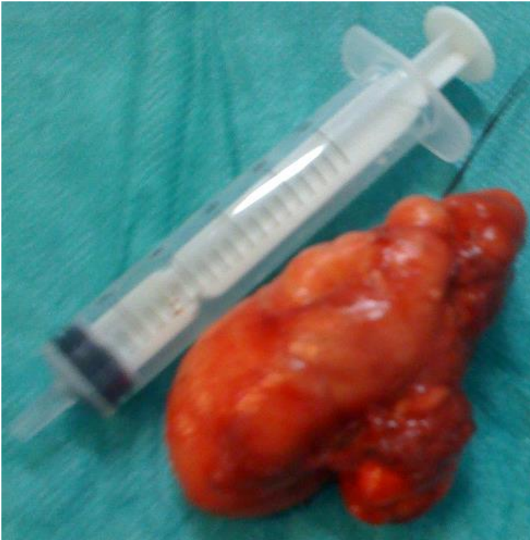
Figure 3: pièce opératoire