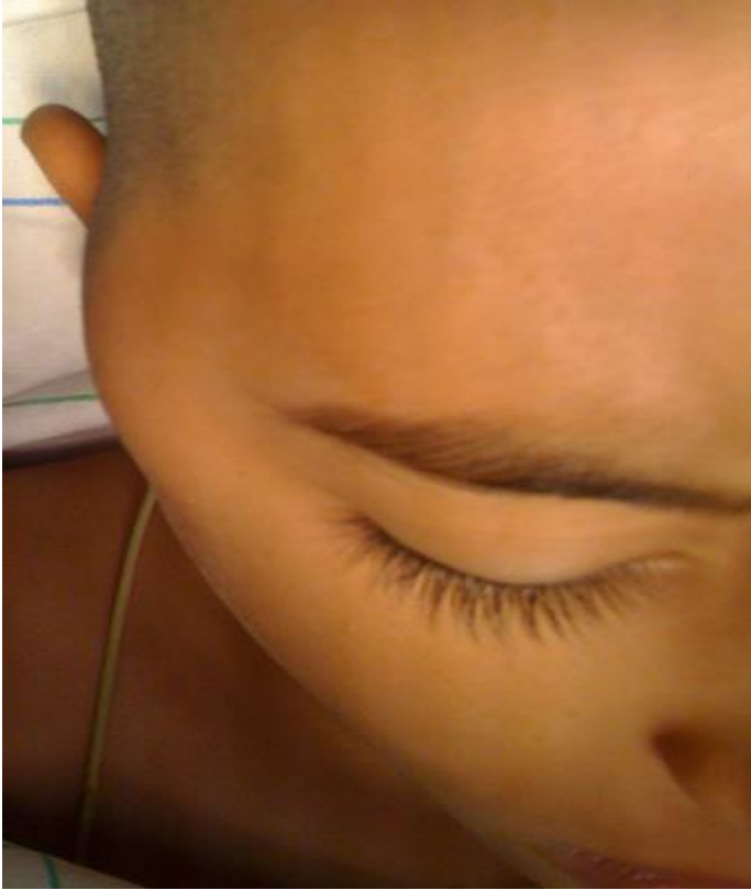
Figure 1: tuméfaction de la région temporo-mandibulaire droite (flèche)