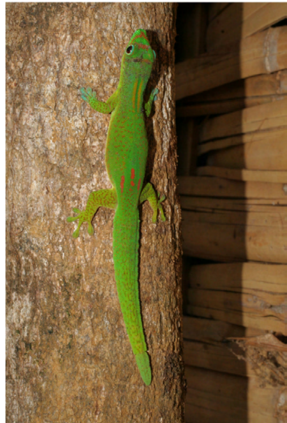
FIGURE 2. Gecko diurne Phelsuma serraticauda sur un pilier d'une maison en bois à Analamboanio dans le quartier d'Ambonivato.

STRUCTURE DE LA POPULATION. L'ensemble de la population observée est composé principalement (87%) par des adultes. Les jeunes éclos sont recensés pendant le mois de décembre. La longueur du museau-cloaque et le poids des femelles adultes sont significativement différents entre les deux phases ( F_{1,32} = 14,142 ; P = 0,0007 et F_{1,31} = 6,467 ; P = 0,01 ), mais la différence n'est pas significative pour les mâles (Tableau 2).