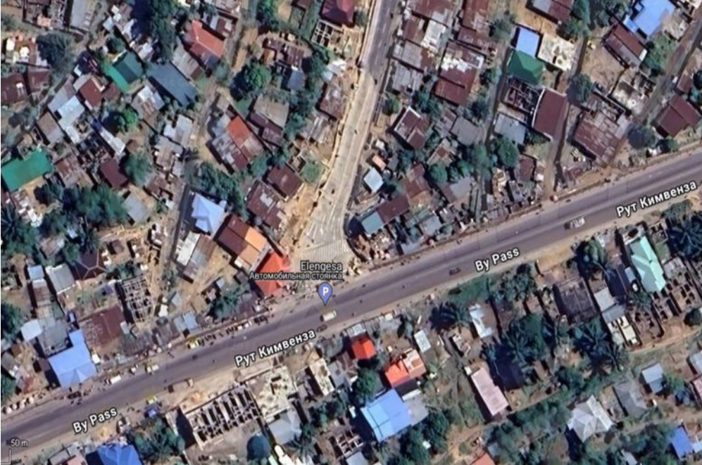
Annexe 1 : Croisement des chaussées Elengesa et By Pass