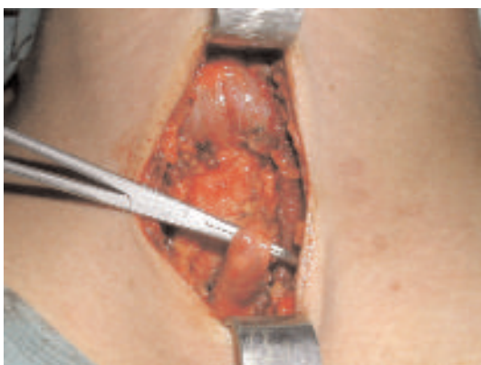
Fig. 2: Aspect per-opératoire de l'adénome parathyroïdien intrathymique.

Après un abord cervical limité du creux sus sternal, on a découvert dans le prolongement cervical du thymus une lésion ovalaire, bien limitée, d'aspect rouge violacé et de 10 mm de grand axe (Fig. 2). Il a été réalisé une exérèse de la lésion emportant le tissu thymique avoisinant (Fig. 3).