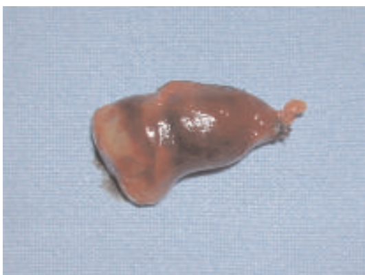
Fig.3: Pièce d'exérèse emportant l'adénome et le tissu thymique avoisinant.

L'examen anatomopathologique de la pièce d'exérèse a conduit au diagnostic d'adénome parathyroïdien intrathymique (Fig. 4).