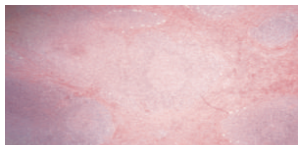
Fig. 3: Hyperplasie des follicules lymphoïdes à centre clair avec des plages importantes de fibrose

L'étude anatomopathologique de la pièce a objectivé un parenchyme parotidien détruit par de nombreux follicules lymphoïdes à centre clair (fig. 3) avec une infiltration des polynucléaires éosinophiles réalisant des micro-abcès (fig. 4), ce qui était en faveur de la maladie de Kimura.