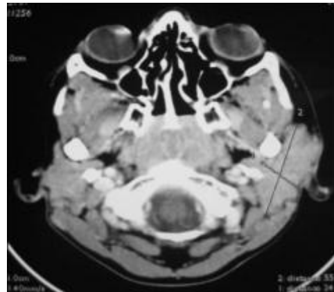
Fig. 2: Tomodensitométrie en coupes axiales montrant l'infiltration de tissu graisseux sous cutané en dehors.

La cytoponction de la glande parotide gauche a révélé une inflammatoir à cellules polymorphes avec l'absence de cellules suspectes.