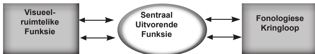
Figuur 1: 'n Diagrammatiese voorstelling van die werkgeheuemodel soos voorgestel deur Baddeley en Hitch (1974). Die uitvoerende funksie reguleer die twee subfunksies: die visueel-ruimtelike funksie en die fonologiese kringloop (Schuchardt et al. , 2008: 515).

Volgens navorsers kom die vernaamste oorsake van leergestremdhede voor na aanleiding van prosesseringsprobleme in die werkgeheue, bestaande uit die uitvoerende funksie wat twee subfunksies reguleer, naamlik die visueel-ruimtelike funksie en die fonologiese kringloop (Schuchardt et al. , 2008: 515; Hein, Bzufka & Neumärker, 2000: 87). Die werkgeheue word beskryf as 'n stel interaktiewe informasieprosesse vir die tydelike stoor en manipulasie van inligting (Gruber, 2001: 1047). Hierdie funksies is uiters belangrik vir hoër kognitiewe funksies soos taalgebruik, beplanning en probleemoplossing (Baddeley, 2003). Die model van die werkgeheue van Baddeley en Hitch (1974), met die klem op die fonologiese kringloop vir die prosessering van taal, bestaan uit drie komponente en word in figuur 1 uiteengesit.