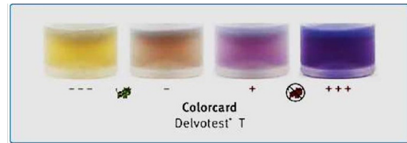
Figure 1 : Colorcard du Delvotest® T pour l'interprétation du résultat d'un échantillon de lait.

Le test ainsi décrit permet la détection d'une large gamme de résidus d'ATB avec une sensibilité élevée pour la tétracycline (Tableau 1).