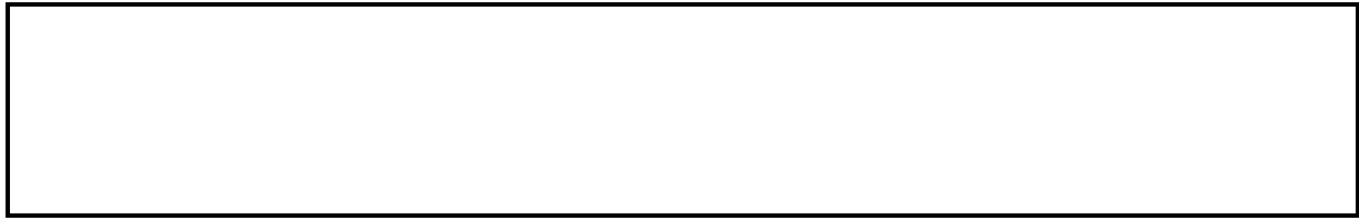
FIGUUR 1: EUKLIDIESE AFSTANDSMATRIKS AS AANDUIDING VAN KONSTRUKGELDIGHED

te verhoog (Bailey, 1987:378). Verder vereis 'n vierpuntskaal dat 'n definitiewe kant op die kontinuum gekies moet word. Die Likert-tipe skaal bied ook die geleentheid vir kwantitatiewe meting om die konstruktgeldigheid te kan bepaal.