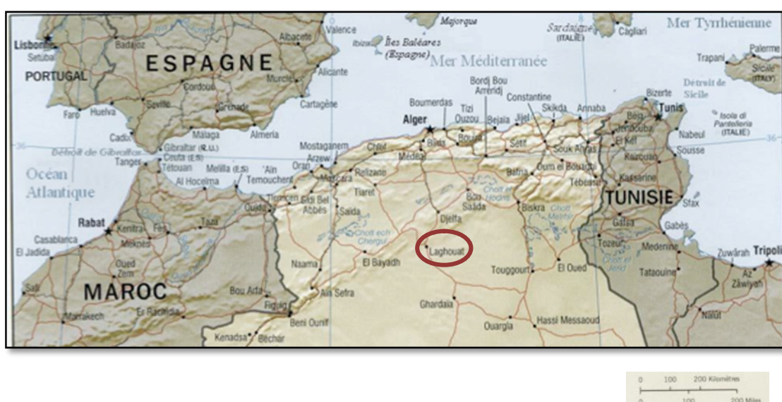
Fig.1. Situation géographique de la zone d'étude.

Au cœur du pays des dayas (Algérie), au sud de la wilaya de Laghouat, se localise notre zone d'étude, plus exactement dans la région de Timzerth. Dayate Aiat se localise à 50 Km du chef-lieu de la wilaya. Ces coordonnées GPS sont 33°31N pour la latitude, 2°56E pour la longitude. Elle se trouve à 871 m d'altitude. Sur le plan bioclimatique, la zone d'étude se situe dans l'étage aride, avec une saison sèche de 11 mois par an (Figure 1).