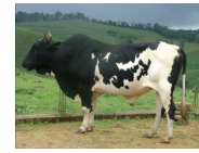
Holstein (67.5%)-Gudali (32.5%) bull Source: Mbah et al. (2020)