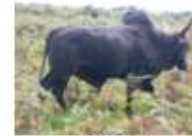
Gudali bull