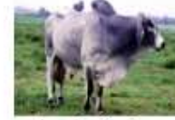
American Brahman