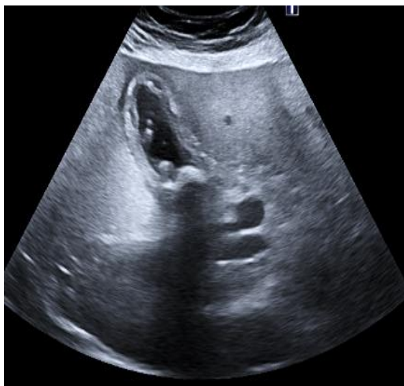
Figure 2 : Echographie mode B en coupe longitudinale montrant une vésicule biliaire multi-lithiasique, à parois épaissies avec une petite collection liquidienne périphérique. Il y avait chez ce patient un signe de Murphy échographique en rapport avec une cholécystite. La prise en charge était chirurgicale.

Les causes de péritonite étaient dominées par les perforations d'ulcère duodénal (n=25) suivies des appendicites (n=21), des perforations duodénales et iléales avec 6 cas chacune. Cependant pour les occlusions, les brides étaient les plus incriminées avec 15 cas (68,18%). Après le diagnostic, une prise en charge chirurgicale a été réalisée chez tous nos patients. Nous avons fait une comparaison entre les résultats radiologiques et le diagnostic opératoire pour définir la spécificité et la sensibilité des différents moyens d'imagerie. La sensibilité et la spécificité de l'ASP pour les occlusions intestinales étaient respectivement de 45,4 % et 21,2 %. Les résultats radiographiques normaux (41 cas) ont été complétés par un autre moyen d'imagerie. De plus, le pneumopéritoine a été retrouvée chez 29 cas sur 60 cas de péritonites soit une sensibilité et une spécificité de 48% et 3,27 % respectivement. La spécificité de l'échographie dans le diagnostic de l'appendicite était de 85,7 % avec une sensibilité de 63%. Parmi les occlusions intestinales, les 5 patients qui ont réalisé le scanner ont été tous diagnostiqués soit une spécificité de 100%. Cependant, sa sensibilité pour les péritonites était de 93 %. Le scanner a été pris en défaut pour 4 patients soit une efficacité de 92%.