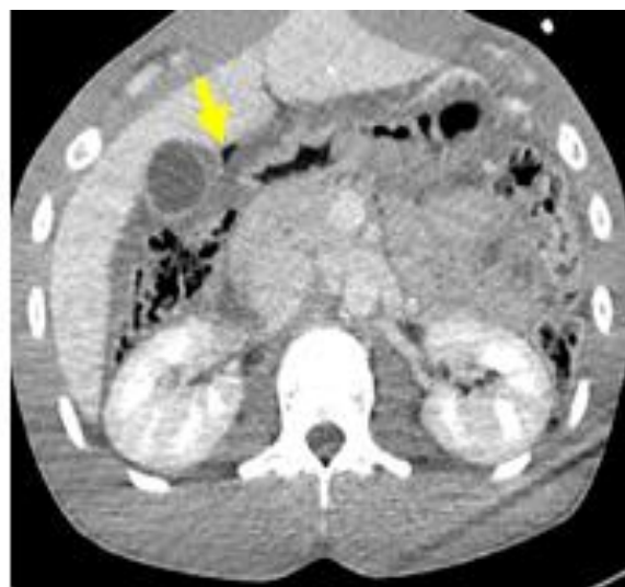
Figure 3 : Coupe axiale TDM abdominale injectée au temps portal mettant en évidence une clarté aérienne extra digestive sous hépatique qui était en rapport avec une perforation gastrique.