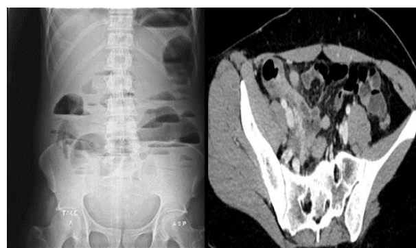
Figure 4 et 5 : radiographie de l'abdomen sans préparation et TDM abdominale, coupe axiale injectée au temps portal du même patient montrant une occlusion intestinale sur hernie inguinale droite étranglée.