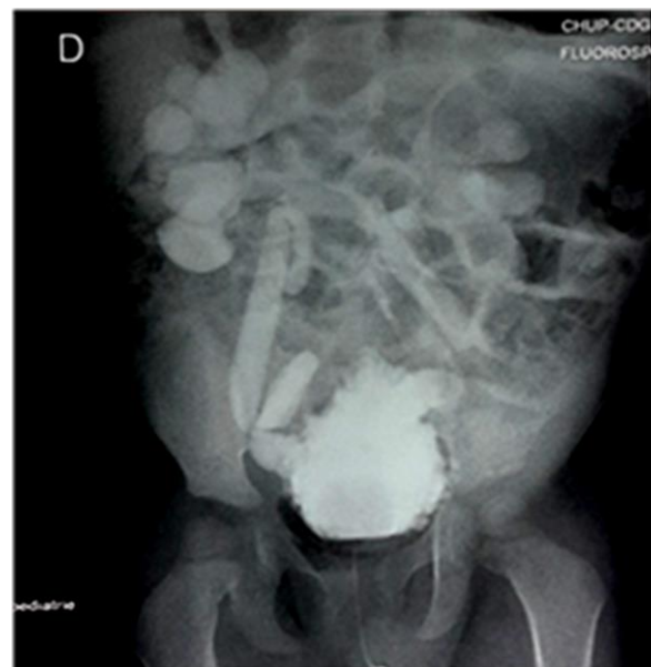
Figure 2 : UCR, incidence de face, phase de remplissage vésical : aspect de « vessie de lutte » et reflux vésico-urétéral bilatéral. (Service d'imagerie du CHUP-CDG)

Des lésions diverticulaires étaient observées au niveau de la paroi vésicale qui apparaissait irrégulière, réalisant un aspect de « vessie de lutte » chez 26 patients (78,7%) ( Figure 2 ).