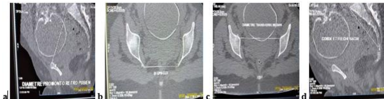
Figure 2 : diamètre promonto-rétro pubien, (c) diamètre transverse médian, (b) diamètre bi épineux, (d) corde et flèche sacrée.