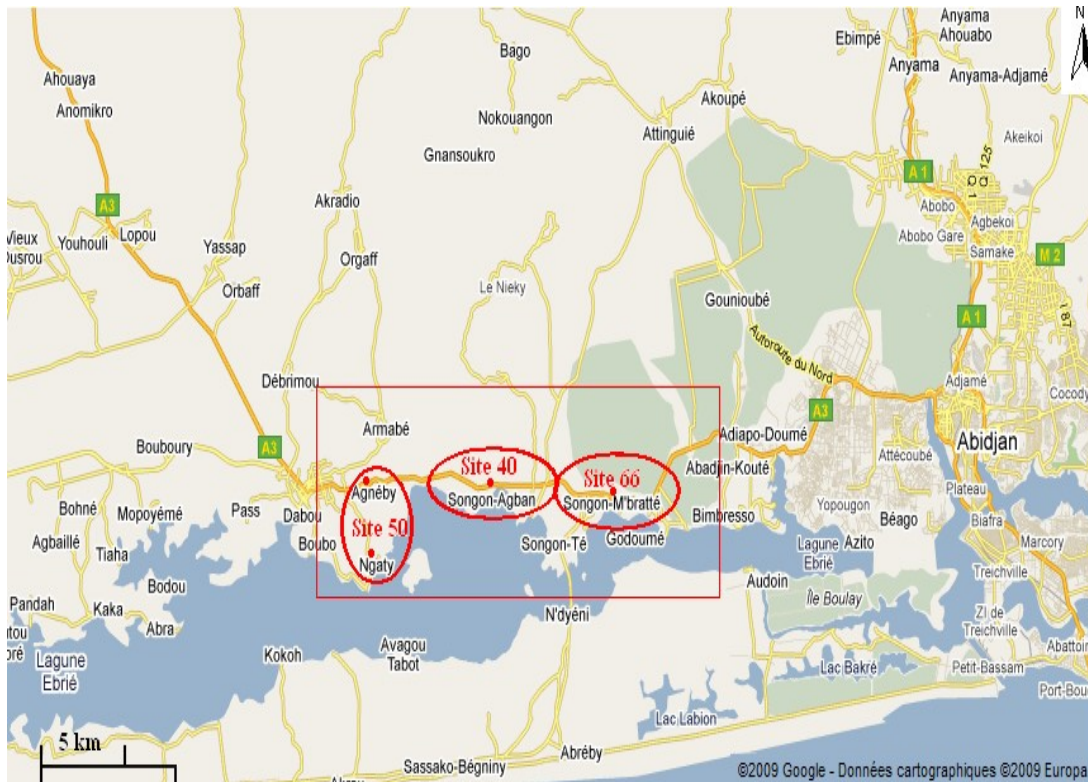
Figure 1-- Localisation des sites de la Compagnie des Bananes de Côte d'Ivoire (CDBC)

Zone d'étude Codes des sites (3) selon l'Organisation Centrale de la Commercialisation de l'ananas et de la Banane Plantations de bananiers (4)