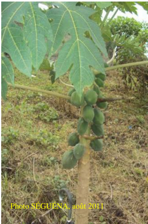
Figure 6 : Papayer, Carica papaya L. (Caricaceae), en fruits