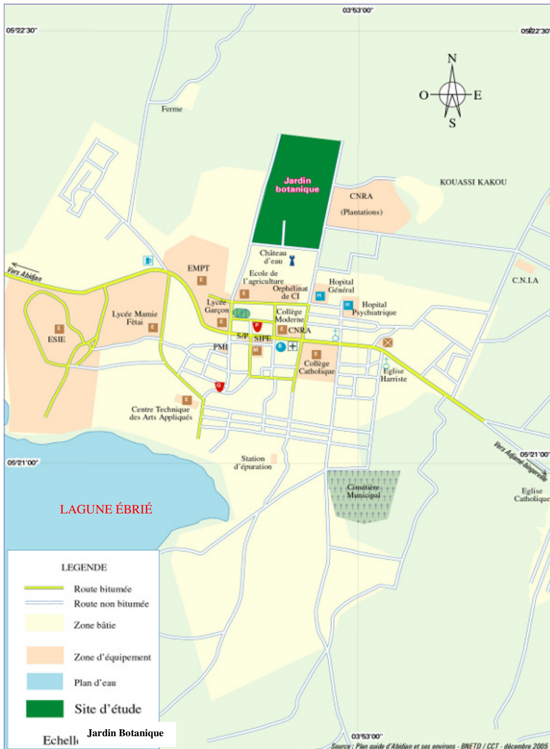
Figure 4 : Localisation du Jardin Botanique dans la ville de Bingerville