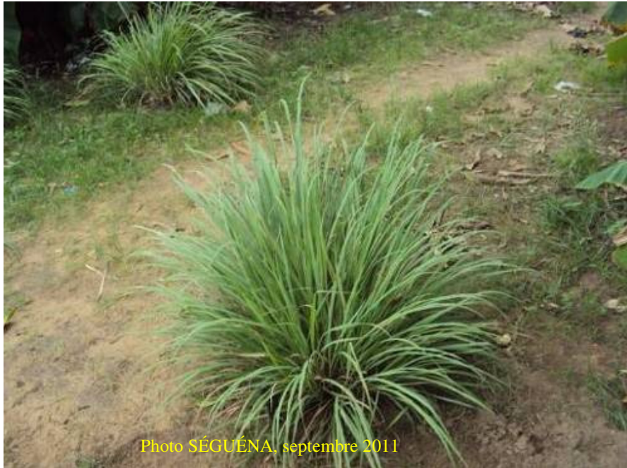
Figure 5 : Touffe de Cymbopogon citratus (DC. Stapf.) (Poaceae)