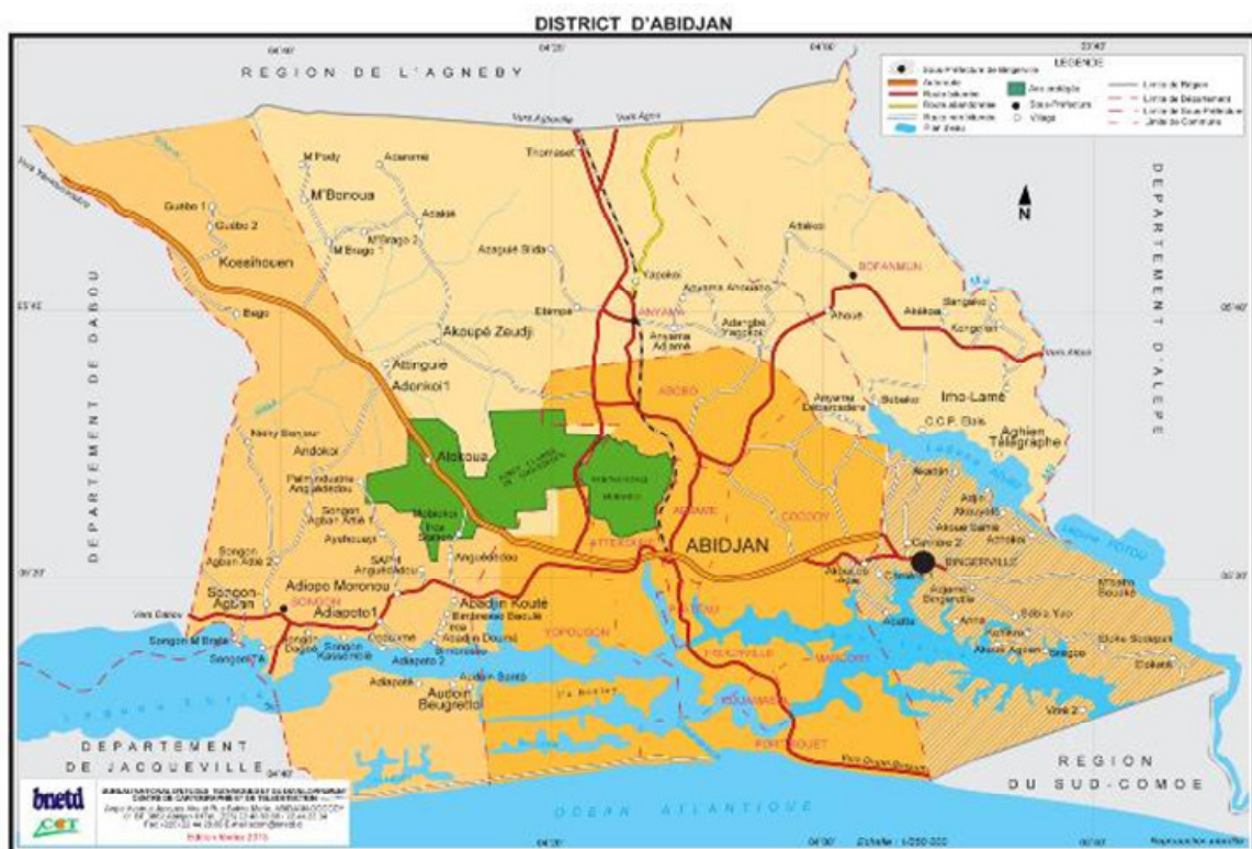
Figure 3 : Localisation de la ville de Bingerville dans le district d'Abidjan (B.N.E.T.D., 2012)