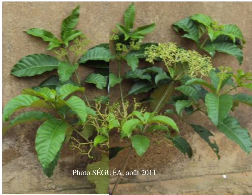
Figure 8 : Rameaux feuillés de Rauvolfia vomitoria Afzel. (Apocynaceae)

- pour obtenir un anti-poison : la poudre obtenue après torréfaction et pulvérisation de feuilles de Anthocleista nobilis (arbre chou), mélangée à de l'huile de palme est absorbée ; la poudre obtenue après torréfaction et pulvérisation de feuilles de Palisota hirsuta , mélangée à de l'huile de palme est absorbée ; l'extrait obtenu après mastication des feuilles de Phyllanthus amarus , utilisé en ingurgitation est un anti-poison ;