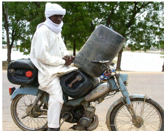
Figure 2 : Collecteur de lait à mobylette

employeurs qui disposent de plusieurs véhicules : le lait est alors convoyé en bidons jusqu'à un point de regroupement, et récupéré par des taxis-brousse avec lesquels ils sont en contrat.