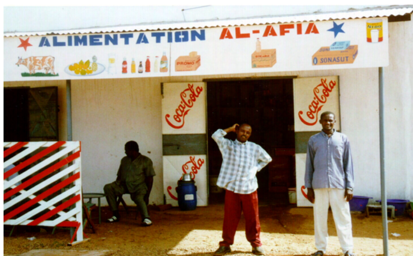
Figure 7 : Vue d'une alimentation (bar laitier)

au Soudan, qui reproduit une habitude de consommation hors domicile d'un lait fermenté, le rayeb . Ils mettent à la disposition des consommateurs urbains un produit répondant à un besoin nouveau, le lait comme boisson rafraîchissante, et enregistrent une augmentation fulgurante de leur nombre dans les quartiers du nord de la capitale à dominance musulmane (Koussou, 2008). Jusqu'à cette période, la totalité des livraisons de lait se faisait à pied.