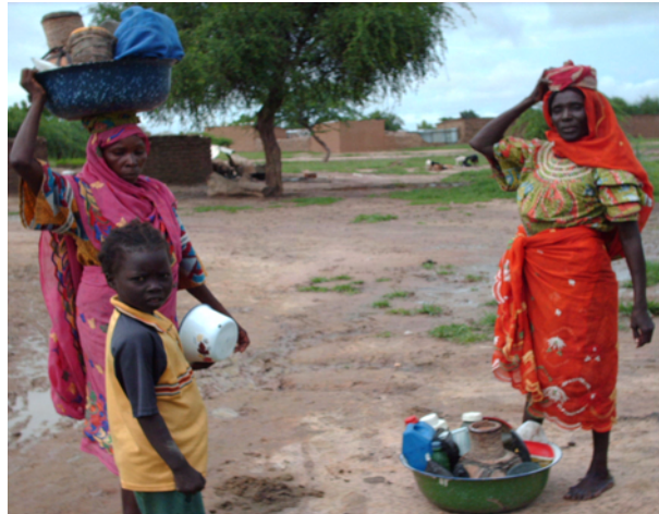
Figure 3 : Talanié rurales à N'Djamena

quartiers de la capitale proches de leur lieu de résidence les bouteilles remplies déposées dans une bassine en émail portée sur la tête pour les vendre à une clientèle fidélisée.