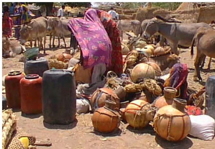
Figure 4 : Marché de lait caillé et beurre clarifié

La dernière filière est celle du lait de chamelle. Mise en place par les arabes Oualad Rachid, c'est la plus récente, puisqu'elle est apparue dans les années 80, et également la plus saisonnière, en raison de la commercialisation du