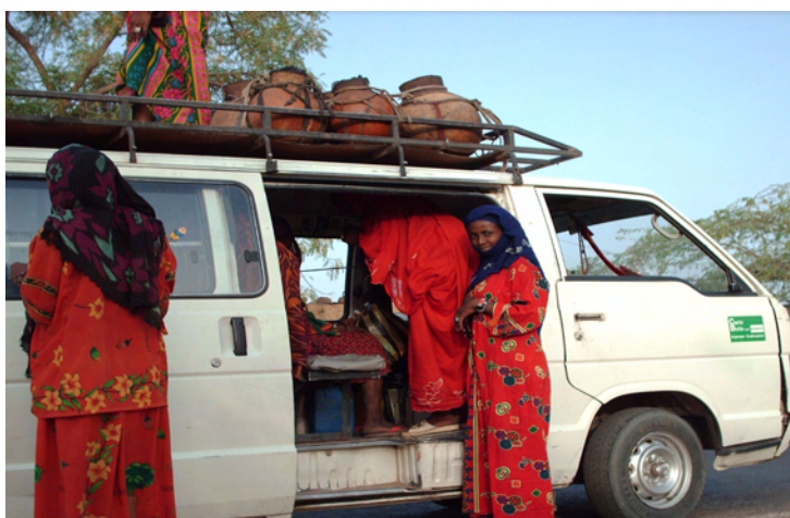
Figure 5 : Un taxi-brousse chargé du transport des productrices de lait

lait en saison sèche lorsque les productrices qui sont présentes dans les environs de N'Djaména se rendent quotidiennement à la capitale dans des taxis-brousse spécialement affrétés (Figure 5).