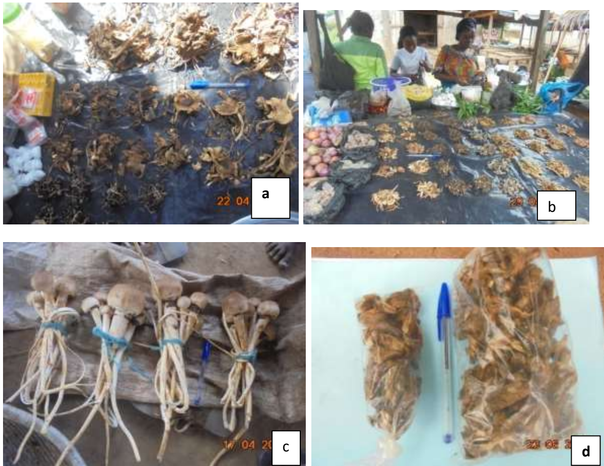
Figure 2 : Quelques espèces de champignons comestibles exposées sur les marchés locaux : a et b : divers tas de sporophores secs étalés sur le marché: tas de sporophores frais de Termitomyces letestui (500 F CFA l'unité) ; b : sporophores secs de Termitomyces letestui ensaché (à la gauche le sachet de champignons est vendu à 100 F CFA le sachet ; le sachet de champignons estimé à 1 kilogramme est vendu a 500F CFA).

des sporophores de Termitomyces , les tas sont à 500 FCFA (prix de vente unique) pendant la période de pénurie (saison non favorable à la fructification) comme indiqué dans le tableau 4.