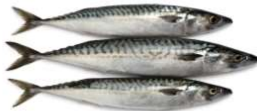
Figure 2 : Scomber scombrus (Maquereau)

Le tableau 1 résume les principes et des méthodes utilisées pour les études microbiologiques.