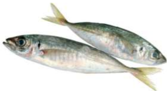
Figure 1 : Trachurus trachurus (chinchard)

étudiés sont : la peau (aspect, état et odeur), des yeux, des branchies, de la chair, la couleur le long de la colonne vertébrale, le péritoine, la cavité abdominale.