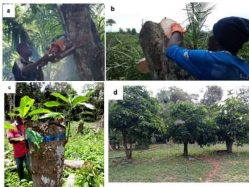
Figure 2 : Étapes de la technique de recépage

a. Recépage d'un colatier à l'aide d'une tronçonneuse ; b. Application de patte cicatrisante à la section ; c. Rejets néoformés sélectionnés ; d. verger de colatiers 3ans après recépage.