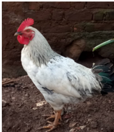
Poulet bourré normale male