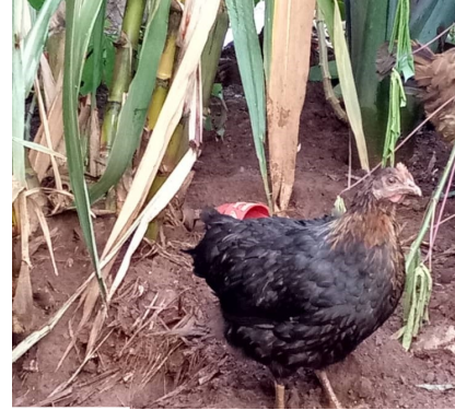
Poulets locaux de la plaine de la Ruzizi