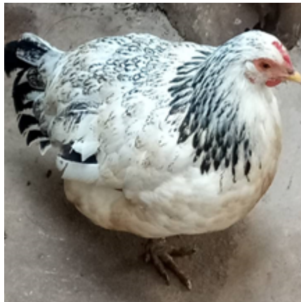
Bourré normale femelle