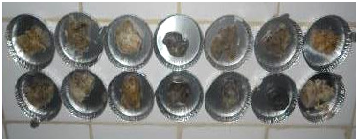
Figure 1 : Échantillons de savons traditionnels préparés

savons traditionnels en solution aqueuse permet de déterminer certaines grandeurs caractéristiques de ces savons telles que la concentration critique micellaire (Concentration à laquelle les molécules tensioactives forment de micelles en solution) et le point de Krafft (température à laquelle les molécules tensioactives forment de micelles en solution). Pour notre étude, la conductivité électrique des savons traditionnels dans l'eau a été déterminée. Pour cela, la méthodologie décrite dans les travaux antérieurs (Mehrotra et al. , 1988 ; Mehrotra et al. , 1994 ; Varma R P & Abha K M, 1983 ; Varmar R P & Goel H, 1994 ; Varma R P & Kumar A, 2000 ; Varma A, 2000 ; Upadhyaya S K, 1997) est celle qui est utilisée. Signalons que ces auteurs n'ont déterminé les paramètres relatifs à la mise en solution de savons qu'à partir de savons purs synthétisés par double décomposition à partir de savons alcalins et de sels métalliques. Seuls certains auteurs ( Adebajo M O et al. , 2001 ; Adeosun B F et al. , 2001 ) font part d'études sur des savons issus de la saponification de triglycérides d'huile de palme.