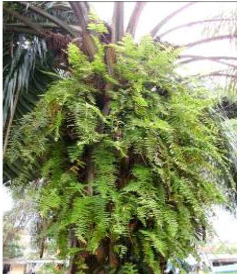
Figure 2 : Nephrolepis biserrata (Sw.) Schott. épiphyte.